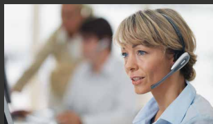
Service & onderhoud