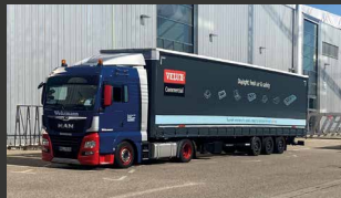
Planning & levering