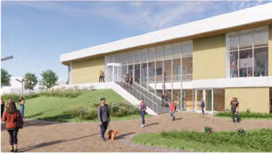
Heerlen - Amsterdam